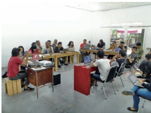
堀田商事株式会社 (ルル学校)

インドネシアのアーティスト集団ルアンルパによる都市を創造的に生きるための未来の寺子屋《ルル学校》が始動。アーティストが会場に常駐し、様々な活動を展開します。