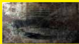
「ground surface」 2015 1500 × 2700mm アートエマルジョンプリント