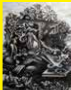
「Vespertine」 2015 1167 × 910mm キャンバス、油彩