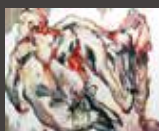
「monster」 2015 1167 × 910mm キャンバス、油彩、木炭