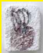
「glasses」 2015 200 × 160mm ミクストメディア