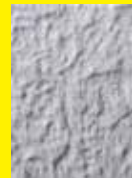
「White cube」 2015 297 × 210mm キャンバス、アクリル