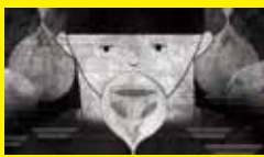
「Midnight Boy」 2015 映像作品

1984 年生まれ 2013 名古屋芸術大学 大学院 同時代表現研究 修了 2013 「CERCLE3」 TURNER GALLERY 「Closed Association」 GALLERY MoMo Projects 「neomorph」 NODACONTEMPORARY 「ART NAGOYA 2014」 ウェスティンナゴヤキャッスル 「世界の見方」 亀井梓、澤恵美展 GALLERY M 2015 「ART FAIR TOKYO」 東京国際フォーラム