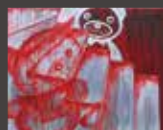
「ひとりじめ」 2015 910 × 1167mm キャンバス、油彩

1992 年生まれ 2014 「フォー」展 (グループ展) T.A.G. IZUTO (愛知) 「田加藤麻由アートプロジェクト 2014」 国登録有形文化財「田加藤家住宅」 (愛知) 2015 「H/ASCA 展」 ダイテックサカエ (愛知) 「BLACK TICKET 2015」 chojamachi TRANSIT BUILDING (愛知)