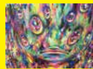
「Angry Baby」 2015 300×415mm パネル、綿布、アクリル、ライストーン、 ラメ、カッティングシート、紙類

1986 年生まれ 2013 名古屋芸術大学 大学院 同時代表現研究 修了 2011 「あちらとこちらのあいだ」 GALLERY GOHON (愛知) 2012 「空間 “ま” 工作実験室」 春日井文化フォーラム shift cube (愛知) 「Doughnut holes may not be sold」 YEBISU ART LABO (愛知) 2013 「似ている物の似ていない事」 YEBISU ART LABO (愛知)