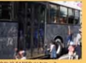
LOCUS FABER ツクロッカ 「らくがきバス」開催風景 2016

日時 / 8.28(日) 9:00-17:00 (走行時間11:30-12:00, 15:30-16:00以外) 会場 / 設楽町田口特産物振興センター 駐車場 対象 / どなたでも 参加無料・申込不要