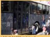
LOCUS FABER ツクロッカ 「らくがきバス」開催風景 2016

日時 / 9.18(日) 9:30-17:00 (走行時間11:30-12:00, 15:30-16:00以外) 会場 / 一宮市博物館 南駐車場 対象 / どなたでも 参加無料・申込不要