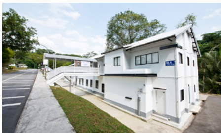
オオタファインアーツ シンガポール

1959年生まれ。草月会館を経てフジテレビギャラリーに勤務。1994年に独立し、オオタファインアーツを設立。現在は六本木とシンガポールでギャラリーを運営。草間彌生、さわひらき、榎木知子など国際的に活躍するアーティストが所属している。アジアや中東の作家を取り扱うプライマリーギャラリストでもある。