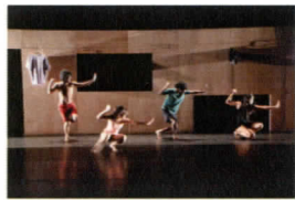
『Room Exit (Terima Kost)』

10月18日(金) 19:00~ 10月19日(土) 14:00~ 10月20日(日) 14:00~