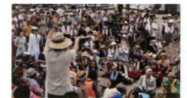
『オーケストラFUKUSHIMA!』2011年8月