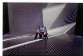
『4. temporal pattern』S20

アジア各国の伝統舞踊ダンサーによる前者は、梅田の振付プロジェクト「Superkinesis」の4作目。後者は前回大好評だった、光・音の表現を伴う梅田自身のソロ・ダンス。