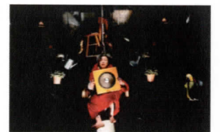
『恋は闇/LOVE IS BLIND』2012年

ベケットの代表的戯曲のひとつを注目の劇団が新訳で上演。主演女優がなぜか腰まで埋まる円丘の舞台美術を、国際的に活躍する現代アーティスト金氏徹平が設計する。