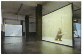
『whenever on on on nohow on | airdrawing』 Five channel video installation 2004, edition 5 + 2 AP Installation view Museum für Moderne Kunst MMK, Frankfurt

ソロで踊るフォーサイスを5台のカメラで捉え、5チャンネルビデオで見せる巨大な映像インスタレーション。タイトルはベケットの『いざ最悪の方へ』に由来する。