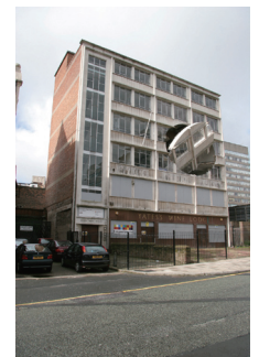
リチャード・ウィルソン 《Turn the Place Over》2007 commissioned by Liverpool Biennial