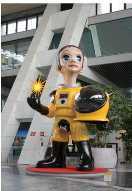
ヤノハケンジ《サン・チャイルド》2011 courtesy of the artist