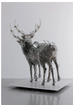
名和晃平 《PixCell-Double Deer#4》2010