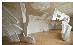
ソ・ミンジョン 《Summe im Augenblick》2010