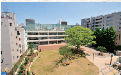
3331 Arts Chiyoda

アーティスト。東京藝術大学絵画科准教授。3331 Arts Chiyoda 統括ディレクター。1963年秋田県大館市生まれ。「美術と社会」「美術と教育」との関わりをテーマに様々なアートプロジェクトを進めるアーティスト。第49回ヴェネチア・ビエンナーレでは日本館の代表作家として参加。1998年よりアーティスト・イニシアティブ・コマンドNを主宰。2005年に活動拠点として「KANDADA」（神田）を立ち上げ、秋田県大館市で「ゼロダテ」、富山県水見市での「ヒミング」など地域での市民参加型アートプロジェクトを数多く手がける。2011年6月、東日本大震災復興支援「わわプロジェクト」を立ち上げる。アートプラットフォームの最先端を開拓し、新たなソーシャル・インクルージョンを実現する。平成22年度芸術選奨文部科学大臣新人賞受賞。