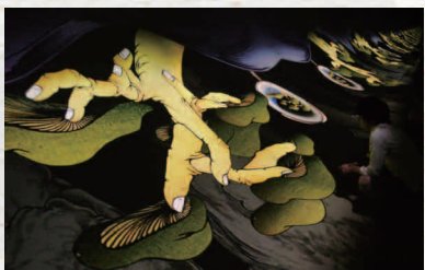
東芋 / てれこスープ / 2011 第54回ヴェネチア・ビエンナーレ美術展日本館展示風景 (C) Tabaimo / Courtesy of Gallery Koyanagi and James Cohan Gallery 写真: Ufer!

国立国際美術館主任研究員。香川県生まれ。1993年より丸亀市猪熊弦一郎現代美術館勤務を経て、2008年10月より現職。主な企画担当展に「東芋：断面の世代」（2010、横浜美術館との共同企画）、「ピピロッチ・リスト：ゆうゆう」（2008）、「エイヤルーサー・アハティラ展」（2008）、「須田悦弘展」（2006）、「やなぎみわ 少女地獄極楽老女」展（2004）、「草間彌生展 Labyrinth-迷宮の彼方に」（2003）、「ヤン・ファン・デル・グロフト」展（2001）、「Isamu Noguchi & Issey Miyake ARIZONA」展（1997）など。第13回パングラデシュ・ビエンナーレ日本参加コミッショナー。京都造形芸術大学非常勤講師。第54回ヴェネチア・ビエンナーレ日本館のコミッショナー。