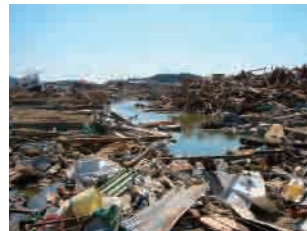
リアス・アーク美術館近郊 気仙沼市、内の脇の状況 (2011年4月5日)

山内宏泰 (やまうち・ひろやす) = 山内ヒロヤス 1971年宮城県石巻市生まれ。リアス・アーク美術館学芸員。1994年宮城教育大学中学校美術教員養成課程卒業、同年10月より現職(現在同館学芸係長、気仙沼市在住)。スロフード気仙沼理事。平成24年度人間文化研究機構国立歴史民俗博物館共同研究員。専門は美術教育、造形理論、現代美術、地域文化教育、津波文化史研究と普及。著書に『砂の城』(山内ヒロヤス・森近代文芸社・2008)。東日本大震災による大津波で自宅を流失。